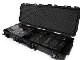
Custom Foam Mousse personnalisée