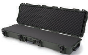
Multilayer Cubed Foam Mousse en cube multicouches