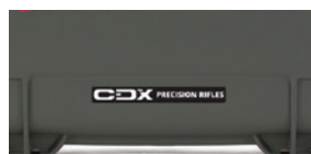
Custom Label Étiquette personnalisée