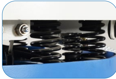
Machine Springs Makine Yayları