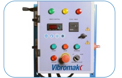
Electric Control Panel Elektrik Panosu