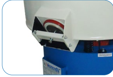
Media Unload Gate Taş Tahliye Kapağı