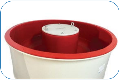
Bowl Inner Design Kazan İç Görünüm

VKU series machines can be used for surface finishing of metal and nonmetal work pieces. These type of machines do not have a separation screen. Generally used for big volume and delicate surfaced work pieces.