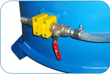
Dirty Water Discharge Valve Pis Su Tahliye Vanası