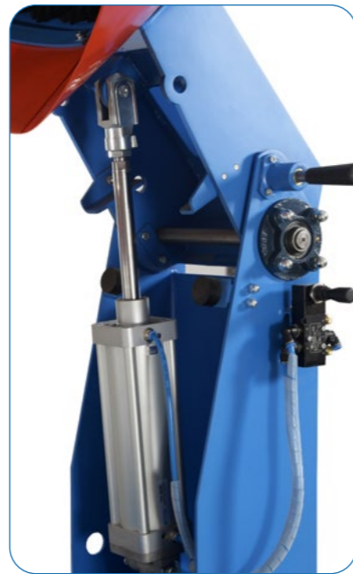
Pneumatic Sound Lid Pnömatik Ses Kapak