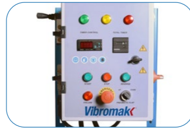
Electric Control Panel Elektrik Panosu