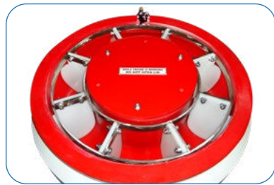
Paddle Wheel Ayrı Bölme Çarkı

VKO series machines can be used for surface finishing of metal and nonmetal work pieces. These type of machines do not have a separation screen. Generally used for big volume and delicate surfaced work pieces.