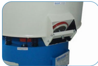
Media Unload Gate Taş Tahliye Kapağı