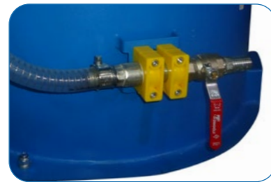
Dirty Water Discharge Valve Pis Su Tahliye Vanası